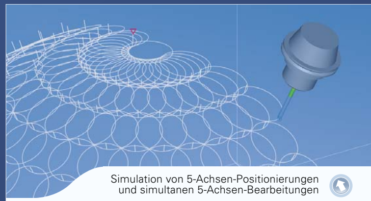
Simulation von 5-Achsen-Positionierungen und simultanen 5-Achsen-Bearbeitungen