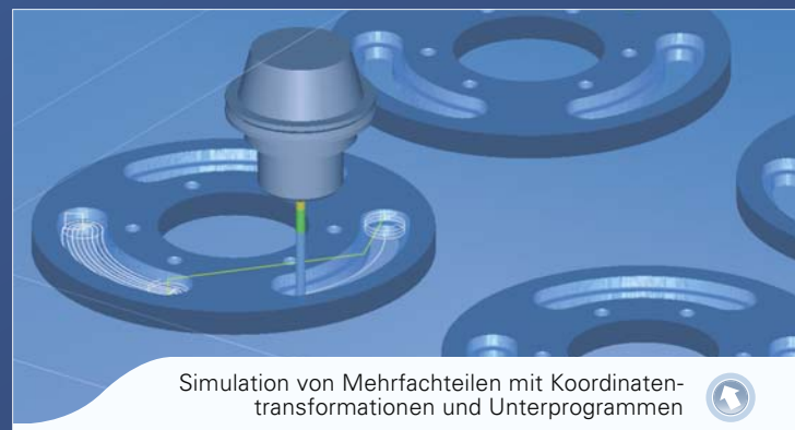
Simulation von Mehrfachteilen mit Koordinatentransformationen und Unterprogrammen